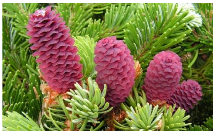
Рис. 2. Ель Аянская - шишки

На все иллюстрации в тексте должны быть даны ссылки.